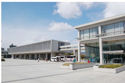
広島平和記念資料館 (の外観)